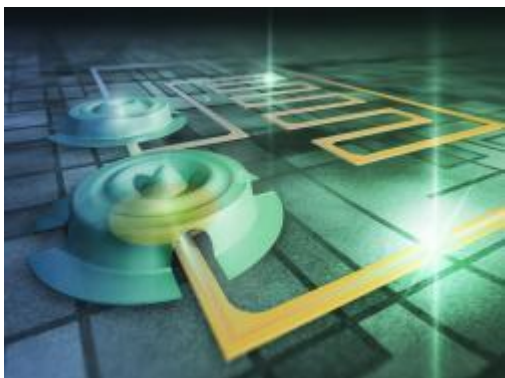
Kvantově provázané mikrobubny na křemíkovém čipu.