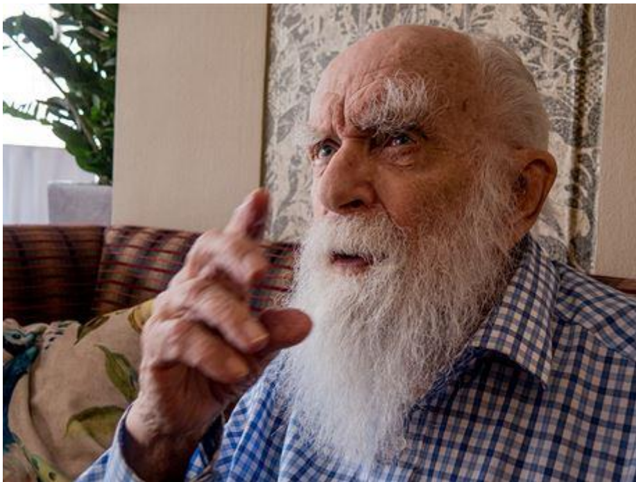
James Randi na návštěvě v Praze

Takže i vzdělaný a racionálně přemýšlející člověk může naletět. Jak do tohoto sebeklamu nespadnout?